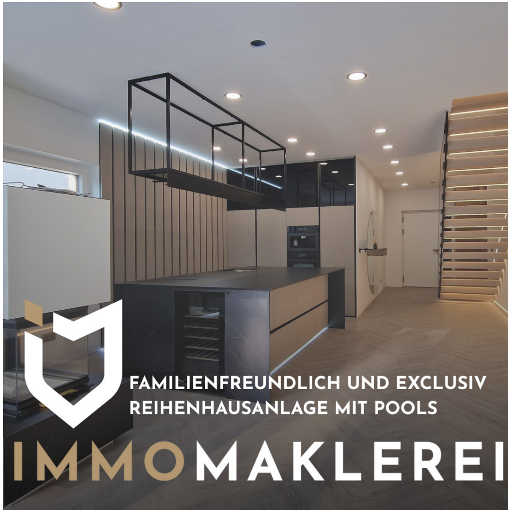
Titelbild mitte 1