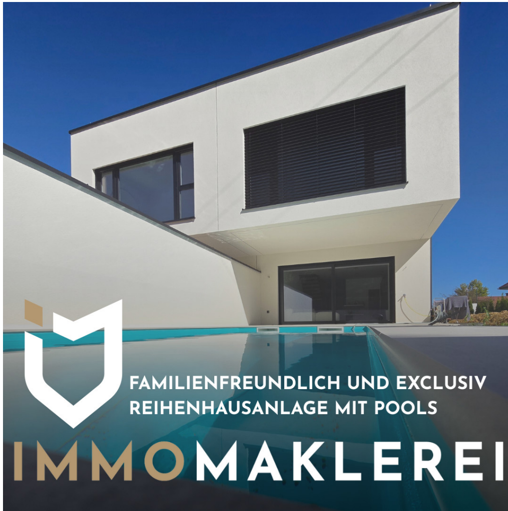
Titelbild außen 1