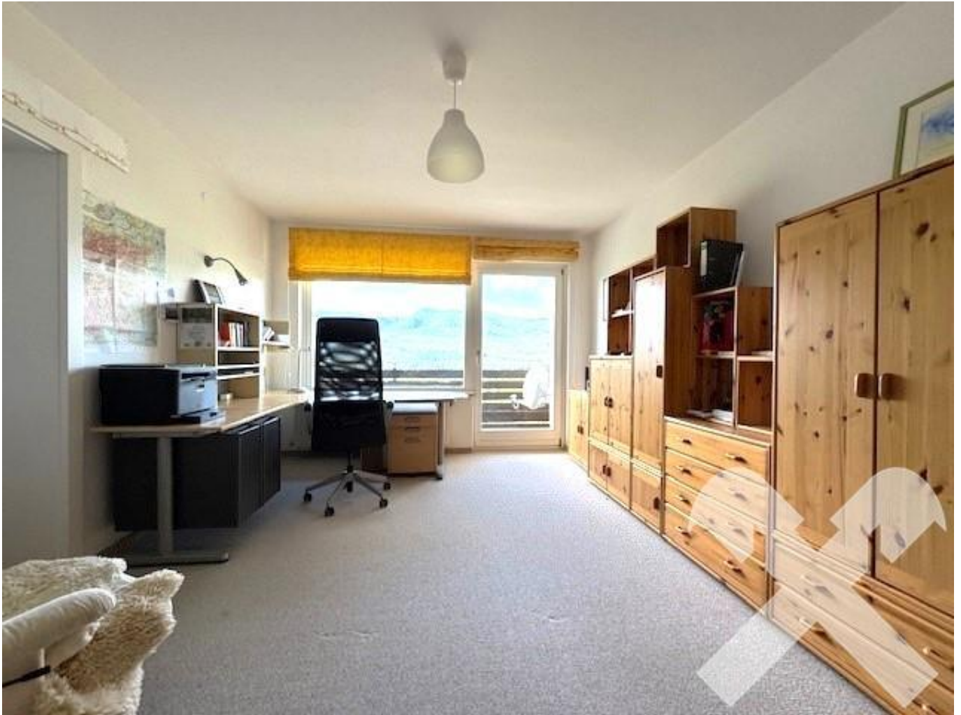
Wohnzimmer mit Zugang zum Balkon