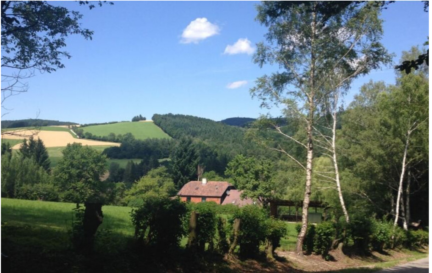
Blick aufs Haus