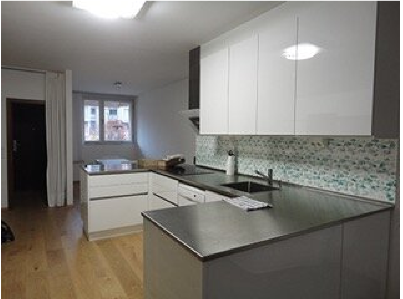
1 Küche_St. Peter Ha