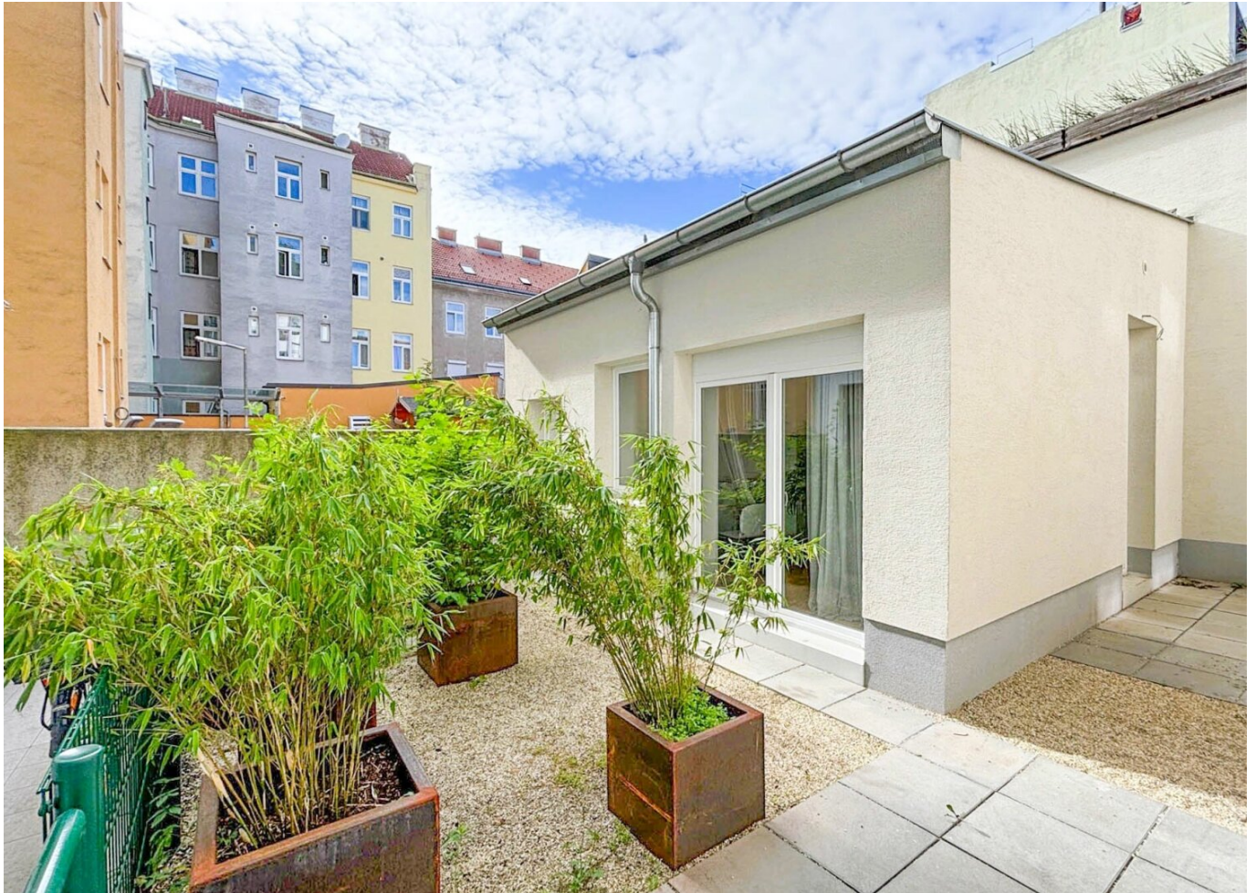
Vorplatz / Terrasse