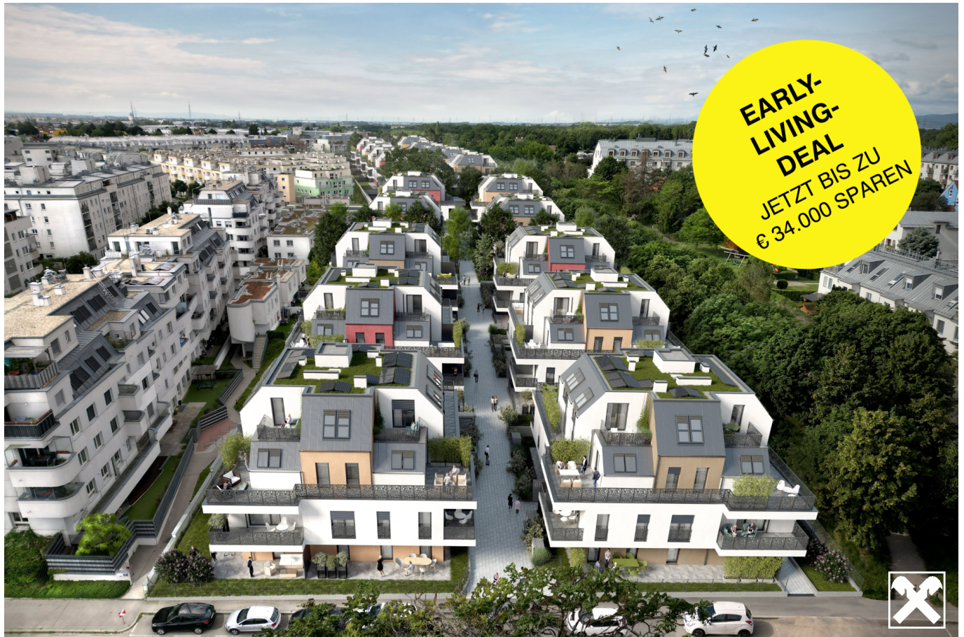
ROSENGARTEN Außenansicht (2)

Preis reduziert - Dachgeschoss mit Terrasse – 2-Zimmer zum Wohlfühlen über den Dächern