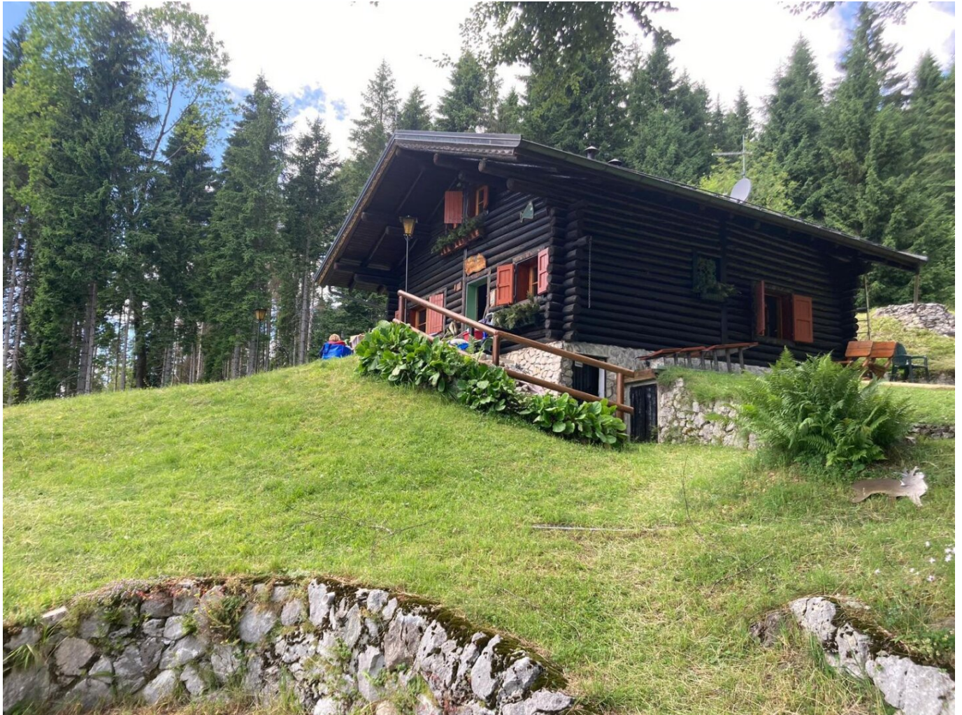
Idyllische Berghütte in den Belluneser Dolomiten