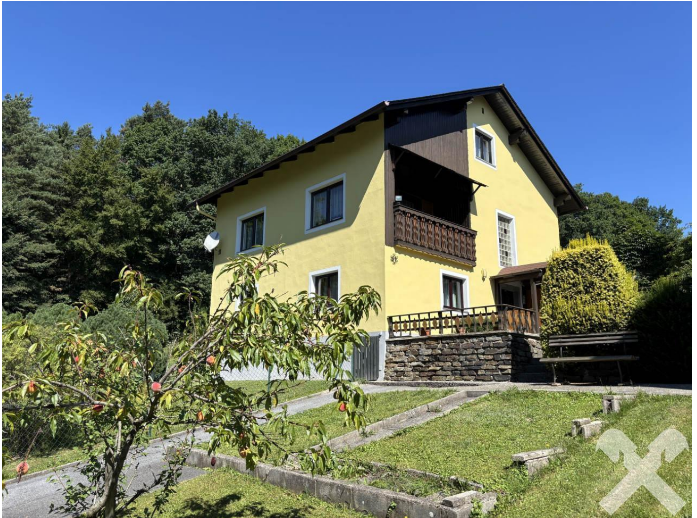
Wohnhaus mit Garten