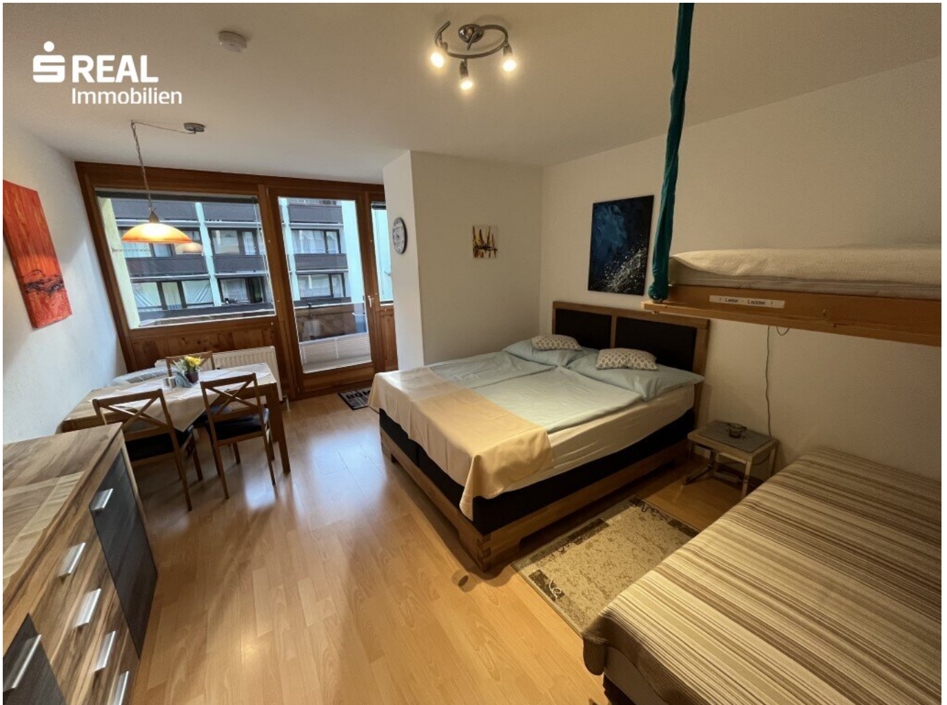
Wohn-/Schlafbereich Wohnung 2