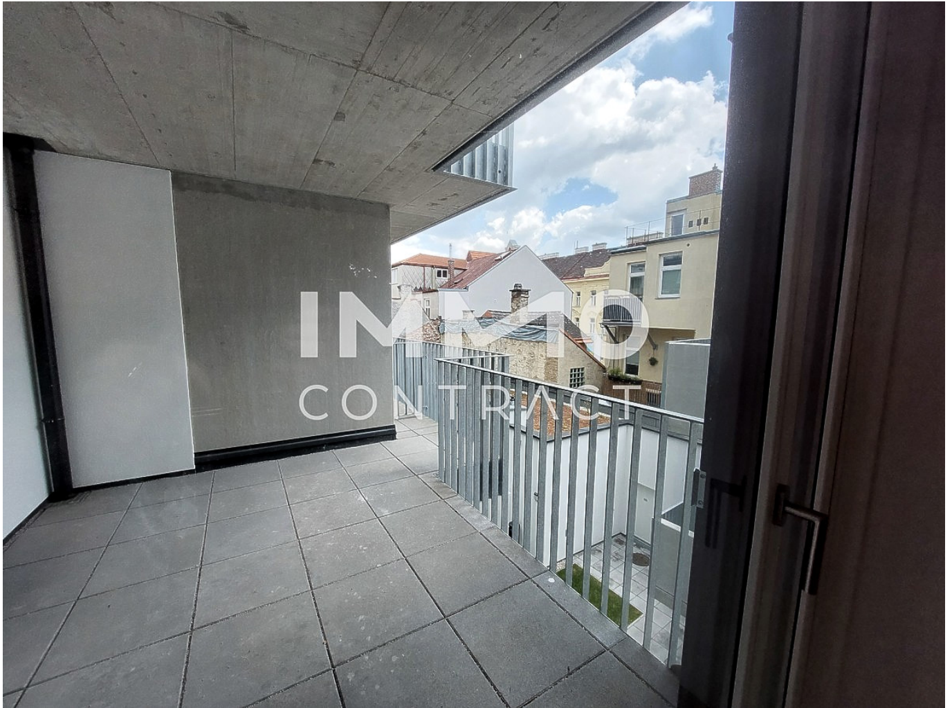
Top 18 Loggia

Vivara - Ihr komfortabler Wohnsitz mit überdachter Loggia, auch bei Regen nutzbar