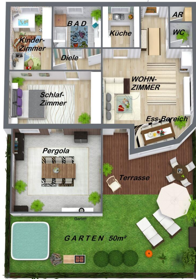
3D Floor Plan

Beste Outdoor- und Wohlfühl Faktor auf der über 50m 2 großen Garten- und Sonnen Terrasse, Garten südseitig, 3 Zimmer, barrierefrei in Graz Wetzelsdorf