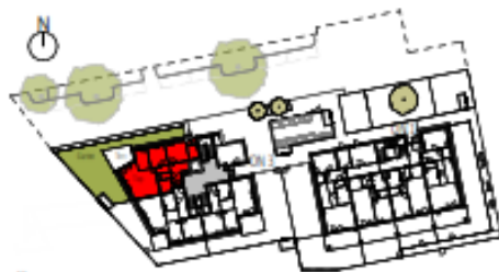
Übersicht Erdgeschoss M=1 : 1250