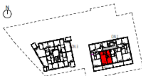
Übersicht 3. Obergeschoss M=1 : 1250