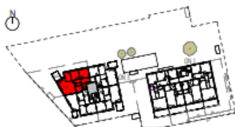
Übersicht 1. Obergeschoss M=1 : 1250