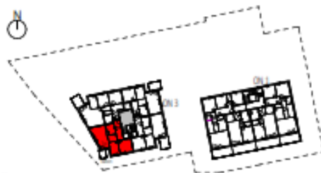
Übersicht 2. Obergeschoss M=1 : 1250