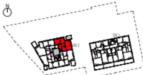
Übersicht 2. Obergeschoss M=1 : 1250