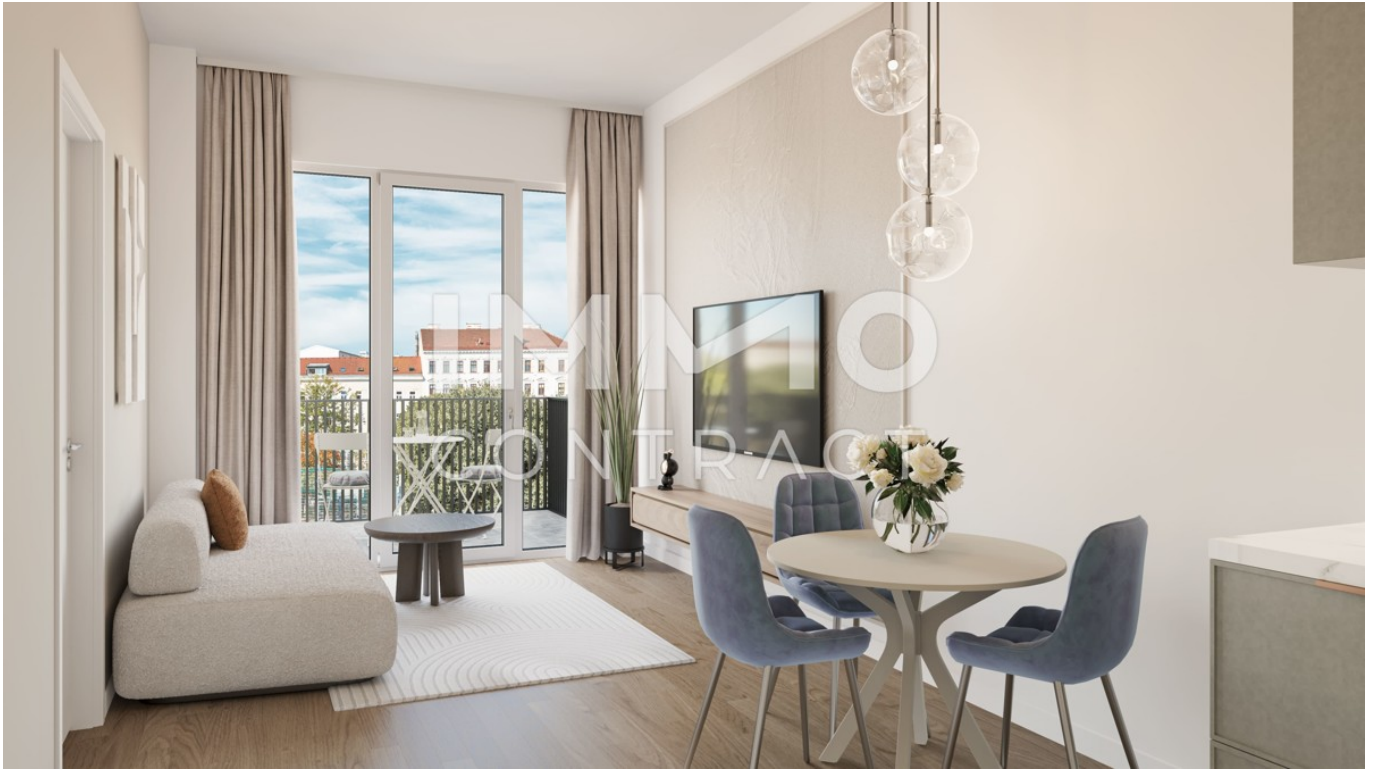
Top 1.36 Wohn-Essbereich