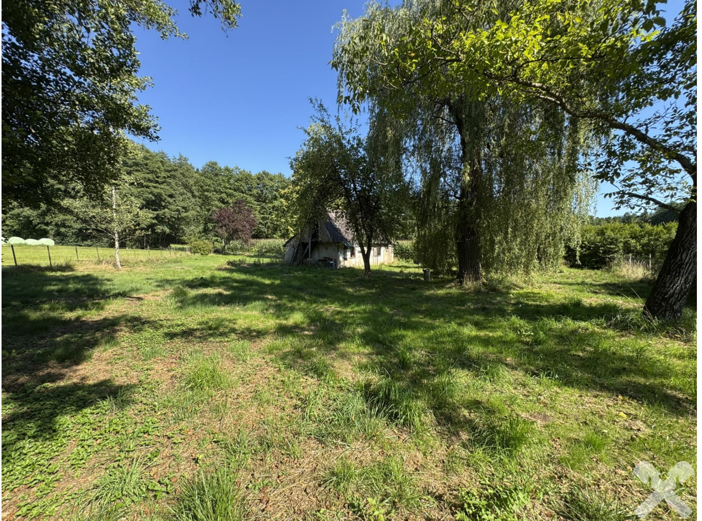
idyllische Oase mit altem Baumbestand