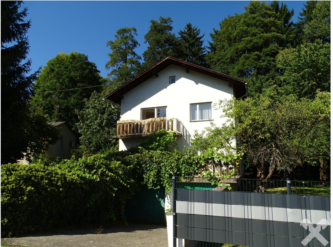
Wohnhaus Ansicht 1