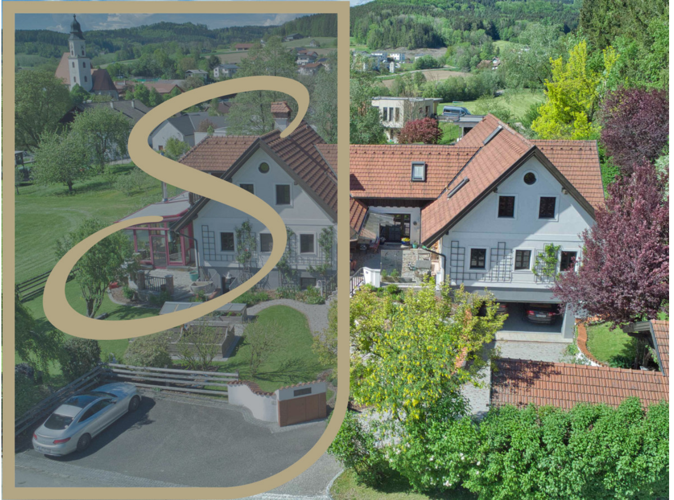
Haus Zell am Pettenfirst