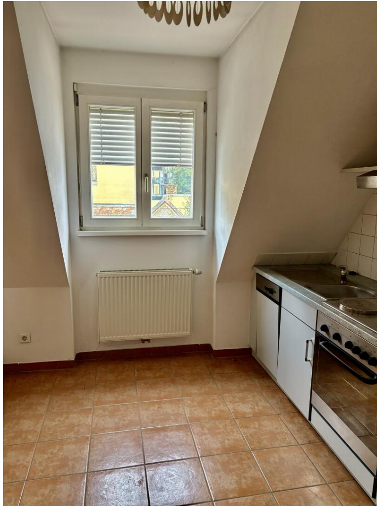
offene Küche zum Wohnzimmer

Urbanes Flair und Top-Infrastruktur: Mietwohnung in Graz, 3 Zimmer, Nähe Technik/Kunstuni, Einbauküche, Galeriezimmer, gute Anbindung.