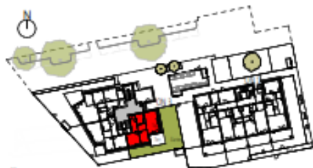
Übersicht Erdgeschoss M=1 : 1250