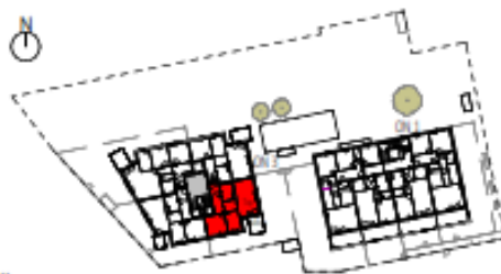
Übersicht 1. Obergeschoss M=1 : 1250