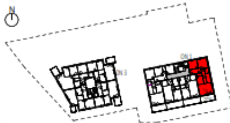
Übersicht 2. Obergeschoss M=1 : 1250