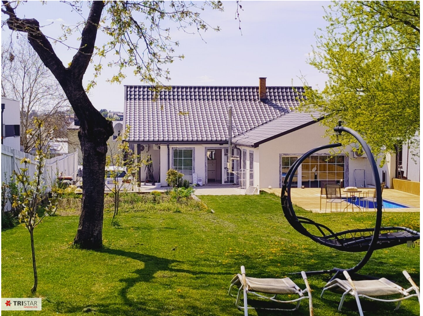
01 - Terrasse-Pool