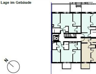
Lage im Gebäude