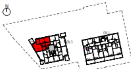
Übersicht 2. Obergeschoss M=1 : 1250