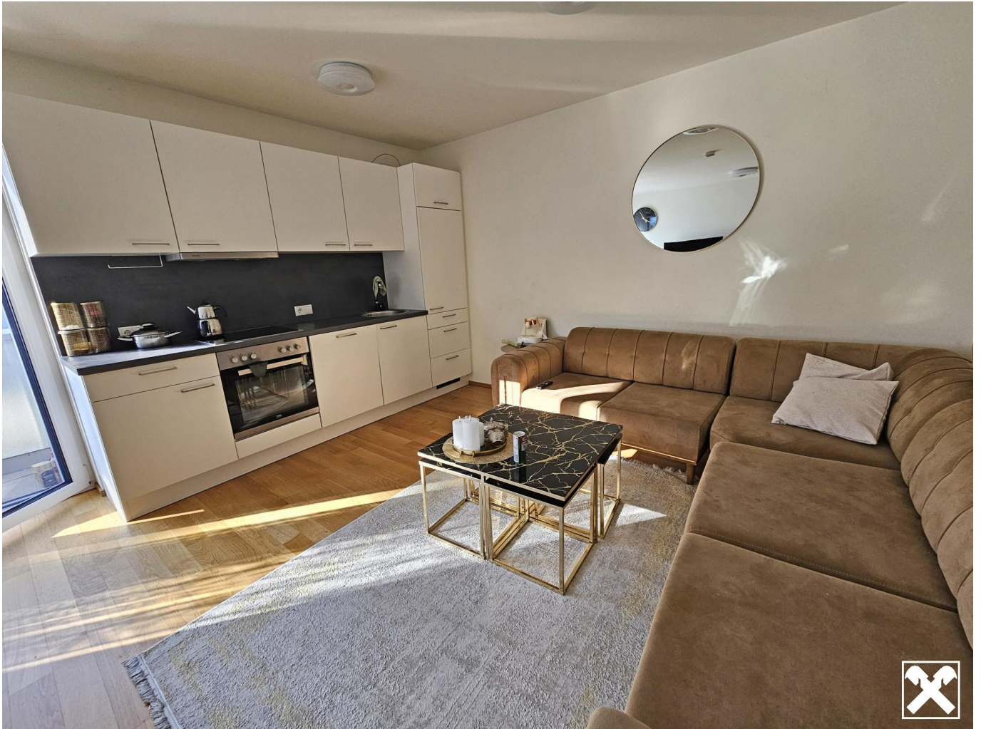
Küche mit Wohnbereich