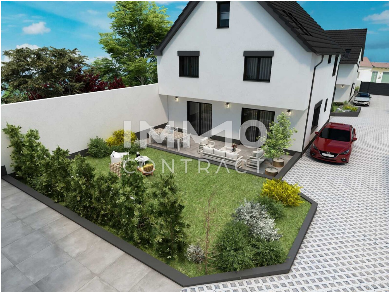
Haus 2 Gartenansicht