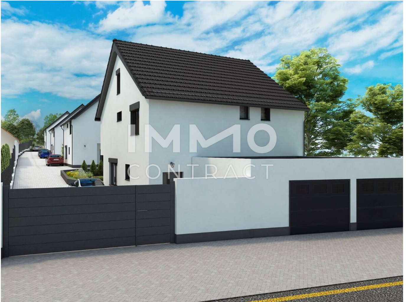
Straßenansicht Haus 1