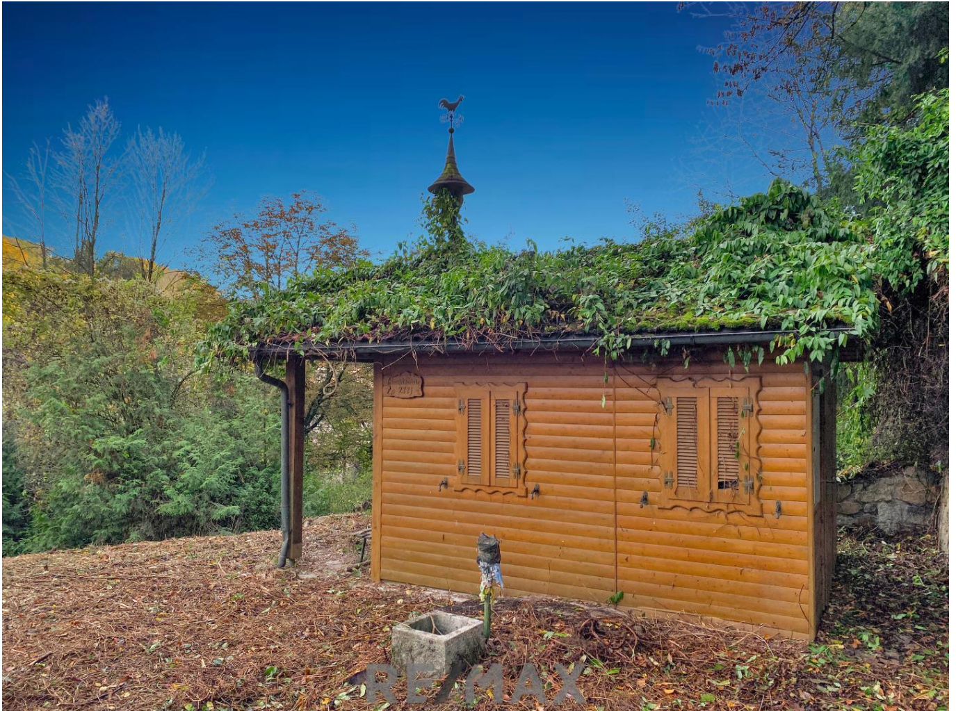
Gartenlaube mit Wetterhahn