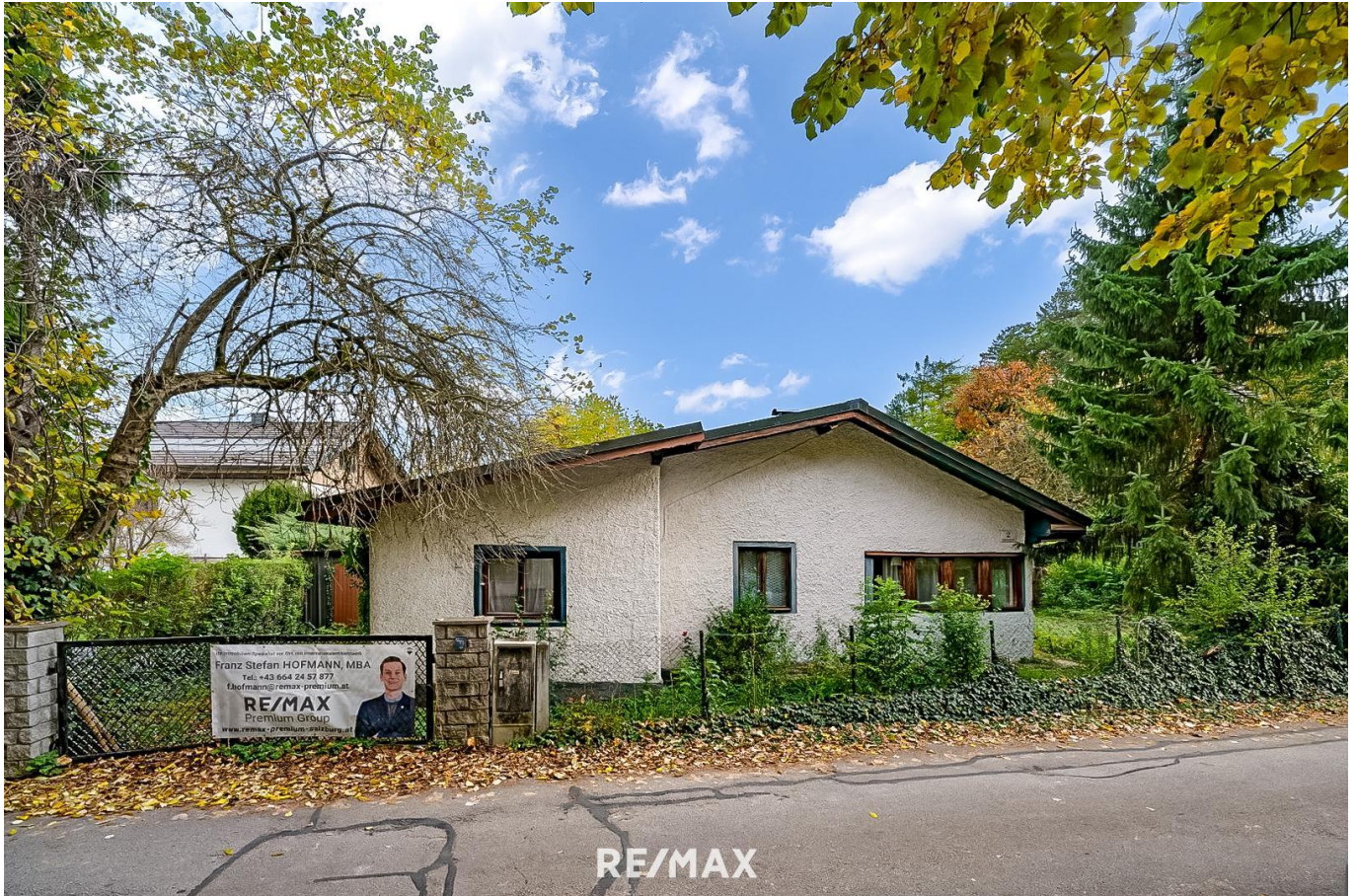
Außenansicht des Grundstückes