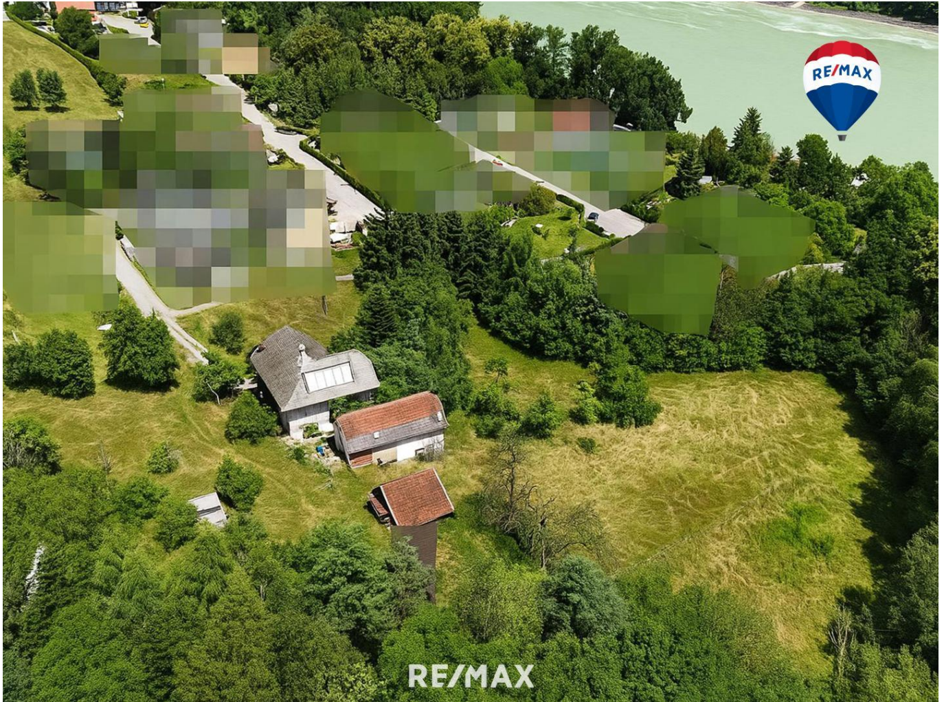
Blick auf den Sommerberg