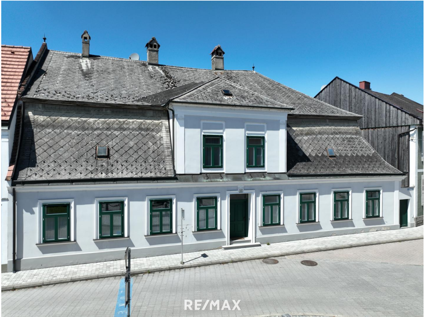
geschichtsträchtige Wohnhaus mit Garten