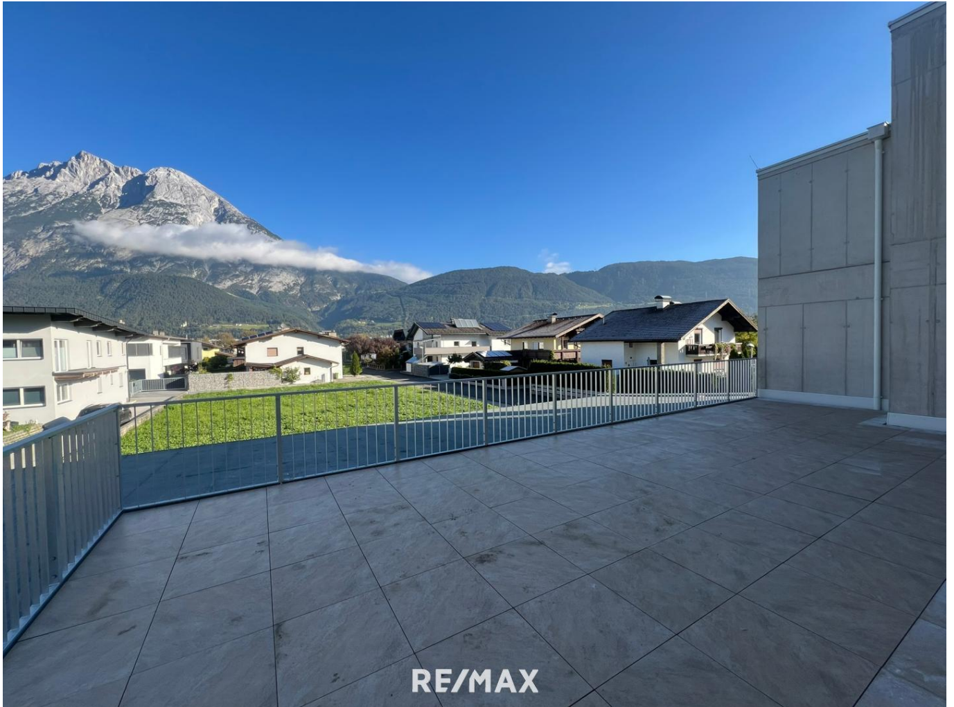
Wohnung Terrasse mit Aussicht