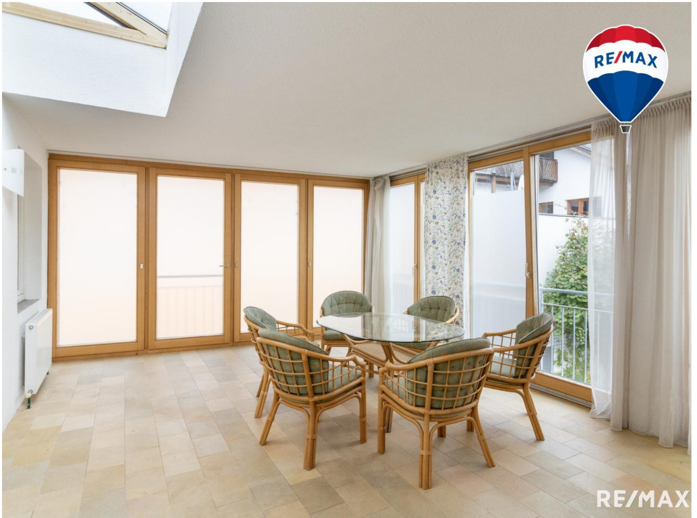
Mietwohnung mit Wintergarten in Bad Zell