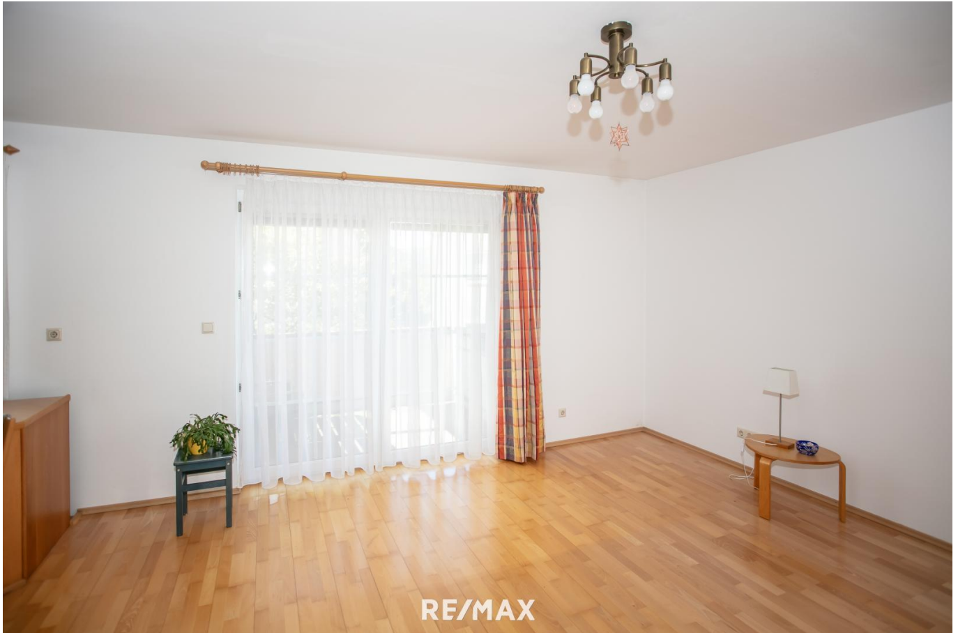
Wohnzimmer Ansicht 1