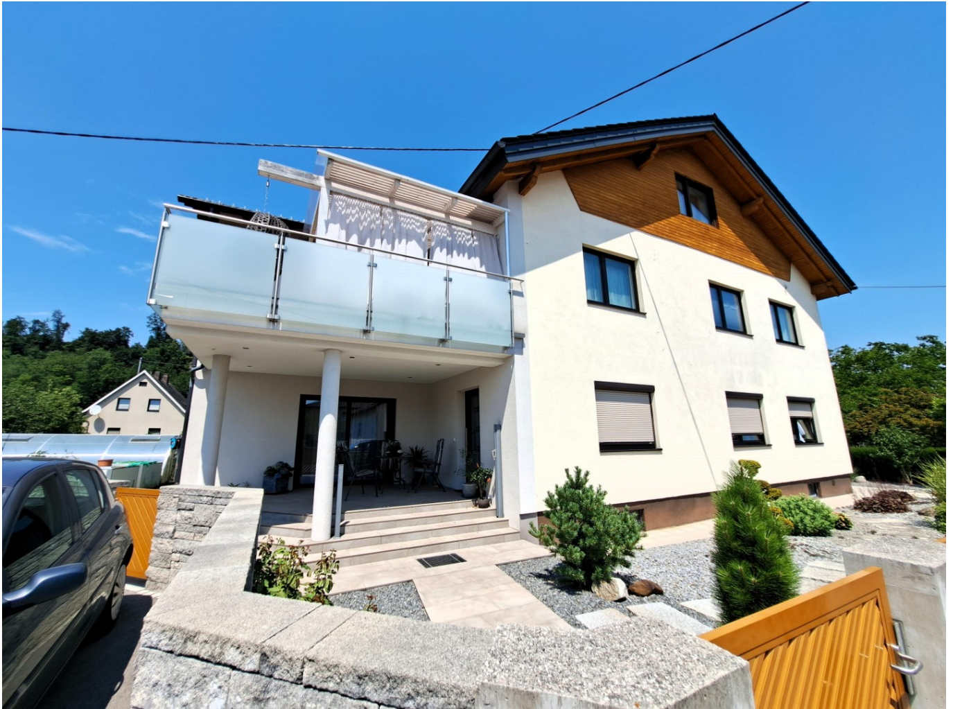
Wohnhaus mit 2 Wohneinheiten, gr. Garten und Pool