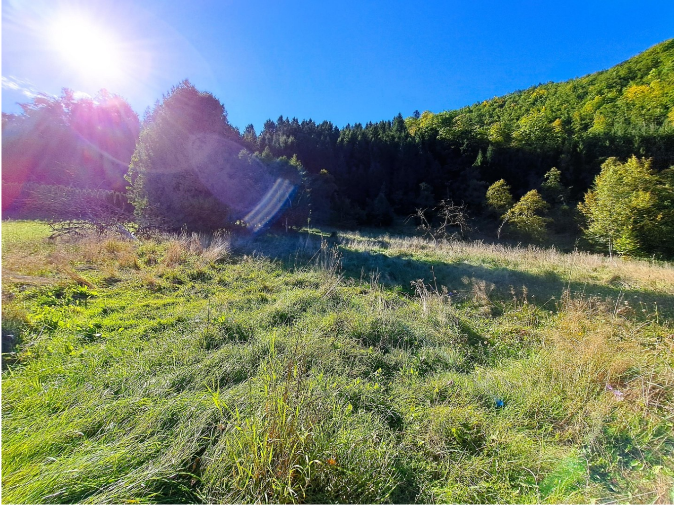
Blick vom Grundstück nach Westen