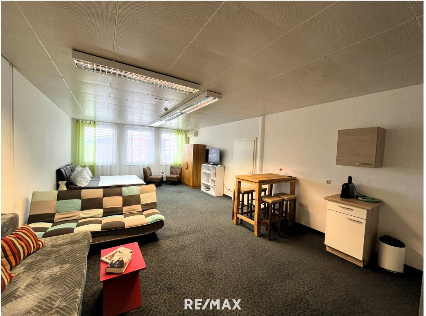
Schlafrum mit Küchezeile D12