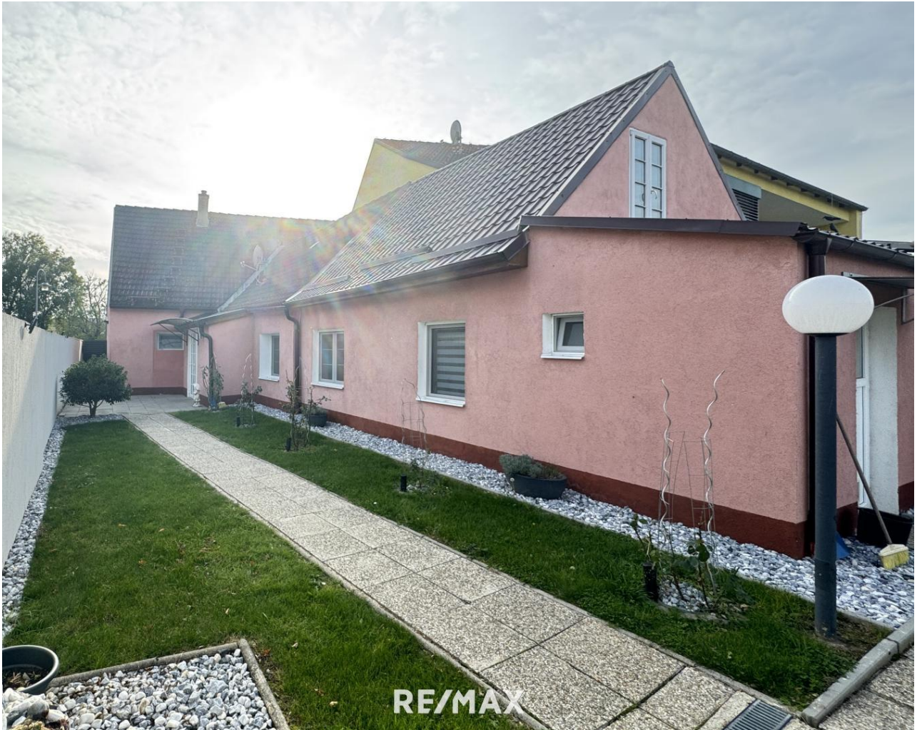
Haus Blick Garten