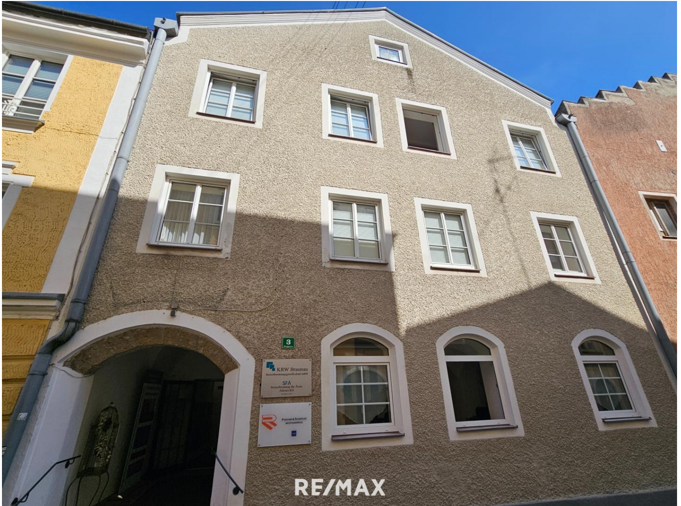
Wohnung in Braunau-Berggasse