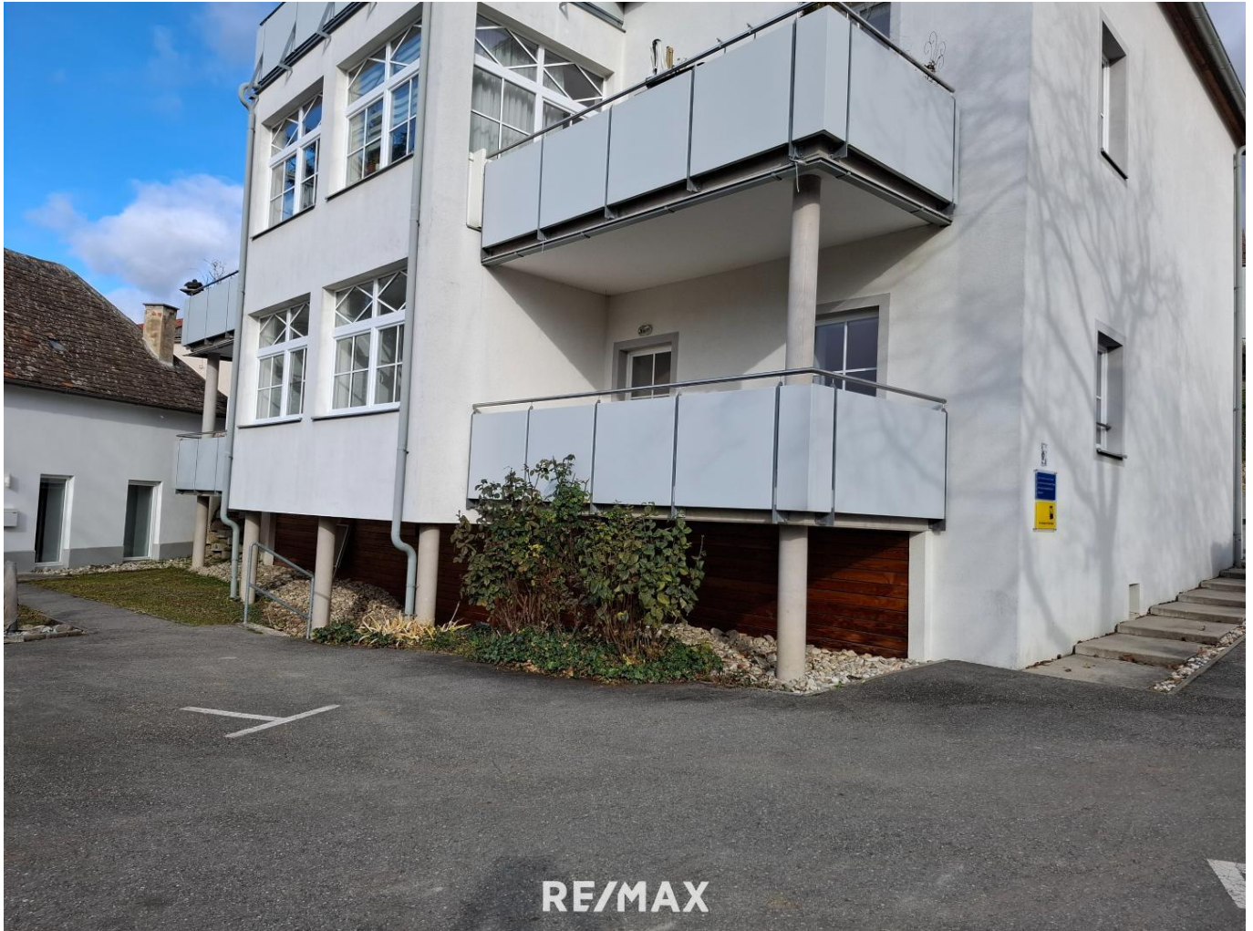
1.) Ansicht außen