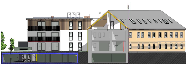
TOP 16 / DG