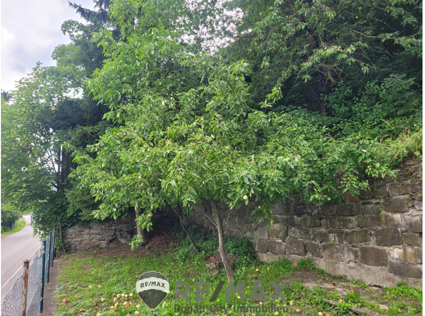
01 Exposé Garten