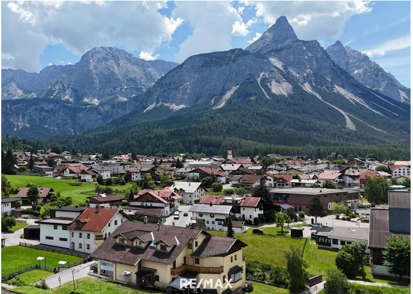
Hotel - Ehrwald