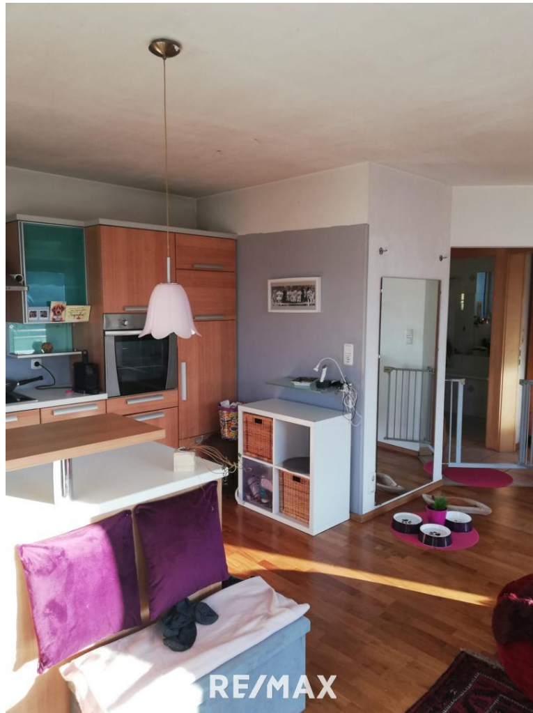
Küche / Wohnen