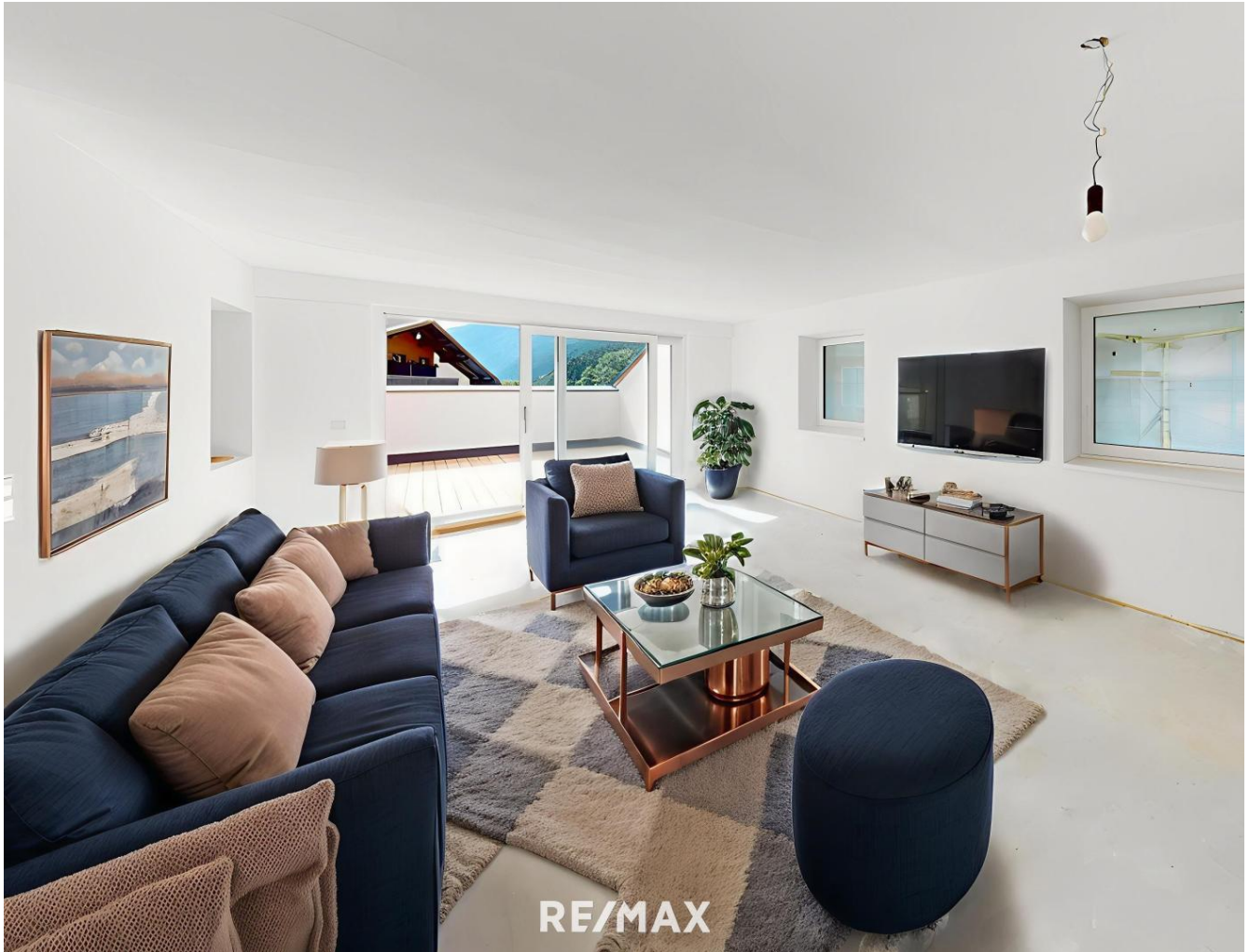
Pfunds - Visualisierung - Wohnzimmer