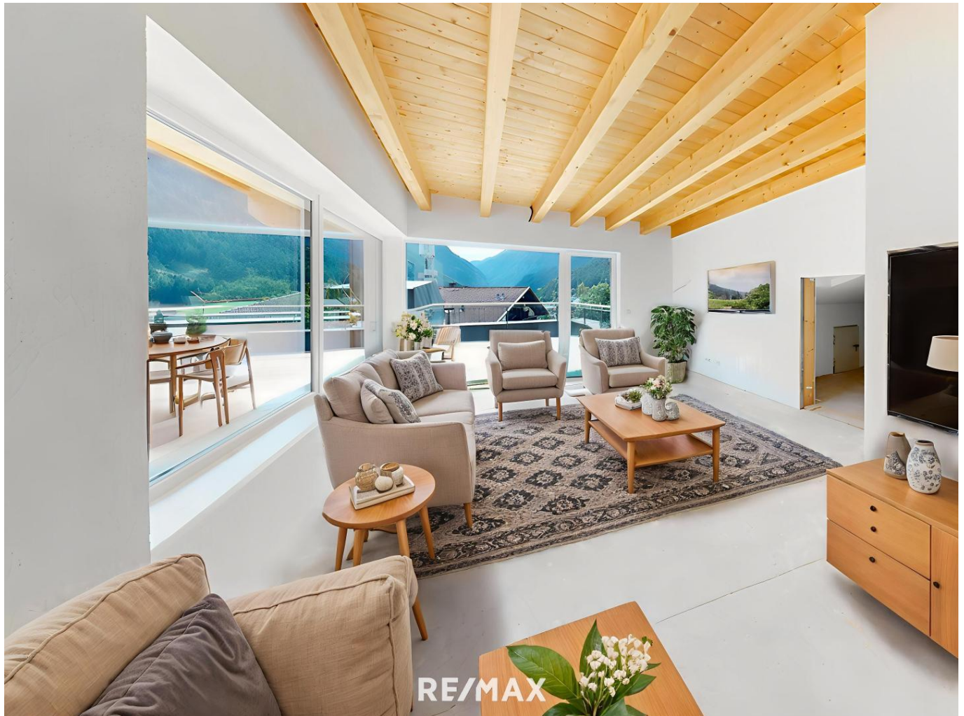
Pfunds - Visualisierung - Wohnzimmer IIII

Objektnummer: 1613_11247 Eine Immobilie von RE/MAX Recon